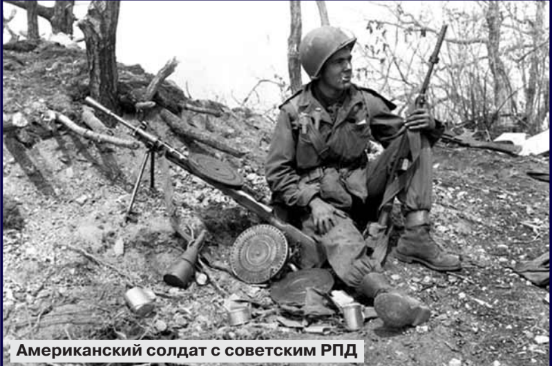
Американский солдат с советским РПД

Не хотелось спорить с Солониным по цифрам, да придётся (самую наглую цифирную ложь автор выложил в последней, третьей статье). Достала меня статистика по специальности: «В 1942-1945 годах по самым массовым лехотым артистематом было израсходовано 84,6 миллиона снарядов к 76-мм пушкам всех типов и 19,4 миллиона снарядов 122-мм гаубиц. Для их снаряжения требовалось 121 тысяча тонн пороха. От союзников было получено (то есть перевезено по морю